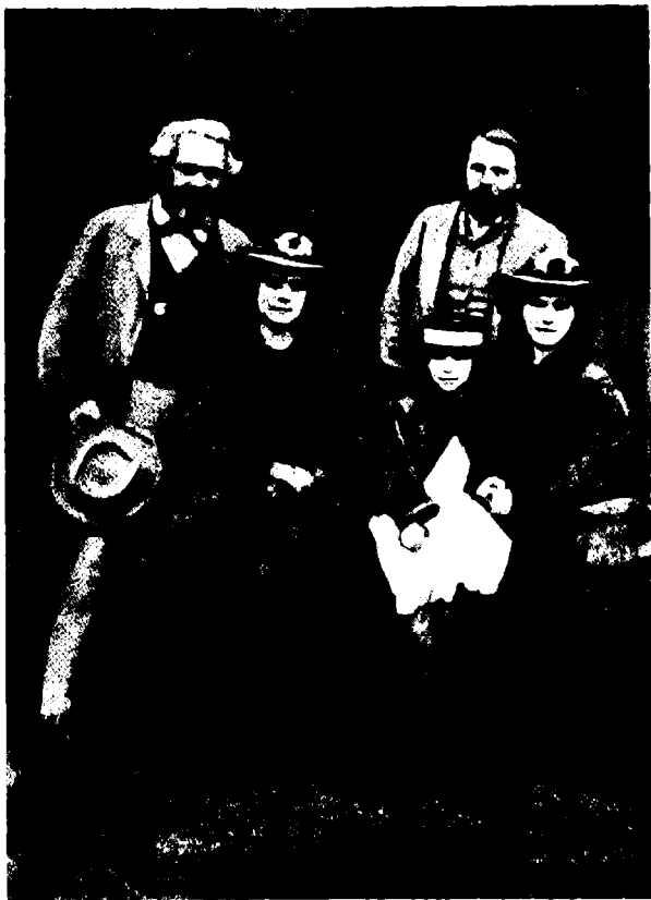
Карл Маркс ии Фридрих Енгелс ку Женни, Лаура ии Елеонора