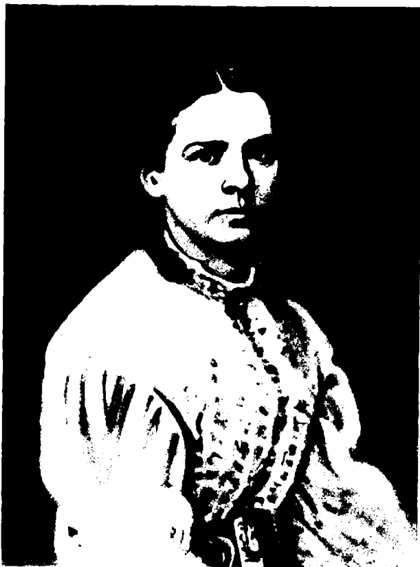
Женни фон Вестфален (дунэ кэсэторие)