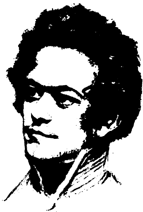
Карл Маркс (дессен)