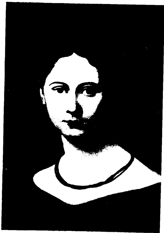
Женни фон Вестфален ын тинереце (портрет ын улей)