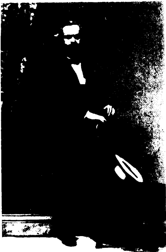
Карл Маркс (Лондра, 1861)