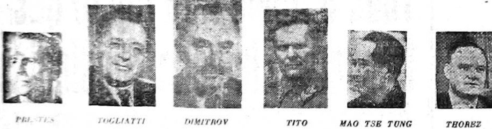
PRESTES TOGLIATTI DIMITROFF TITO MAO TSE TUNG THOREZ

com o progresso, a paz, o bem estar, a civilização estão